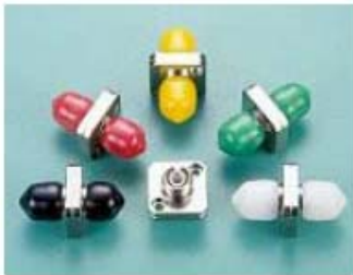
FC/FC mit Flansch