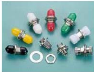
FC/FC f. D-Lochung